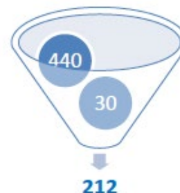
Figura 1: Refinamiento del glosario

La Figura 2 representa cómo está presentada cada entrada del glosario.